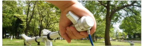
Palm Brake Bar

この特長により高齢者の弱握力や手に障がいを持つ方でも自転車に乗れる可能性を十分秘めています。自転車も人も選ばないユニバーサルデザイン形状は、カスタマイズ性にも優れ、スポーツ系クロスバイクやMTBにも似合います。