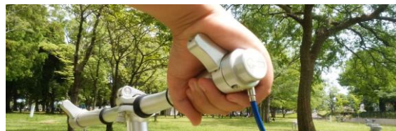
Palm Brake Bar

この特長により高齢者の弱握力や手に障がいを持つ方でも自転車に乗れる可能性を十分秘めています。自転車も人も選ばないユニバーサルデザイン形状は、カスタマイズ性にも優れ、スポーツ系クロスバイクやMTBにも似合います。